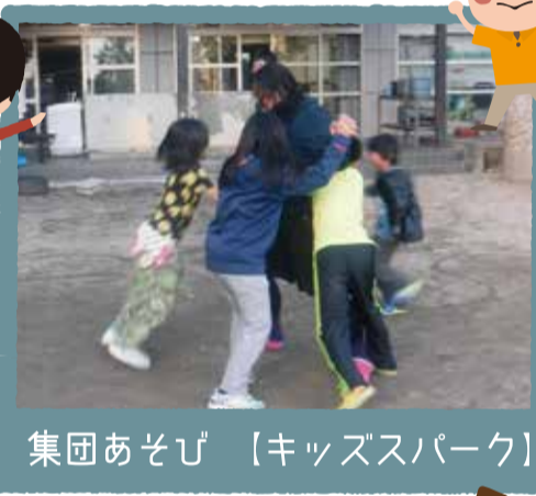
集団あそび【キッズパーク】

こどもたちはあそびのながでいろんなことを学びます。チームで作戦を立てたり、高学年が低学年に指示したりすることでコミュニケーション力やリーダーシップを身に付けていきます。最近流行の「Sけん」では、力では大人にかなわなくても、みんなで大人に勝負を挑みます。「みんなで押しだせ〜！」