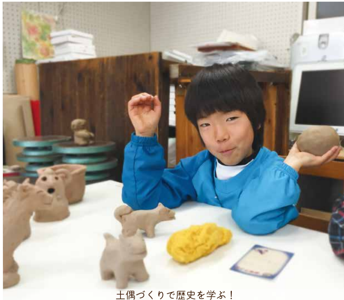
土偶づくりで歴史を学ぶ!