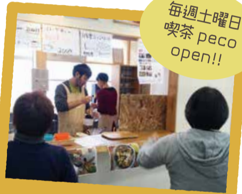
1F 展示コーナー 喫茶ペコ

様々な生きづらさを感じている若者達が、自分たちのペースで、少しだけチャレンジできる場として生まれたカフェ「喫茶ペコ」。毎週土曜日午後に出店しています！ぜひご来店を！