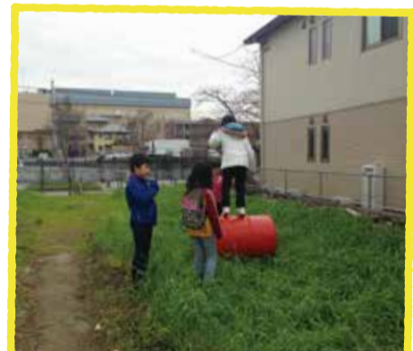
ドラム缶で麦踏み！

らいとぴあが建っている北芝地域で取り組まれている祭り「たいまつ・むぎわら」。今年は自家製の麦で「むぎわら」を作ろうと画策中。冬の間は麦踏みをすることで青々と繁る強い麦になるとのこと。単に踏むだけではおもしろくないので、ドラム缶の上に乗って踏んでみました！