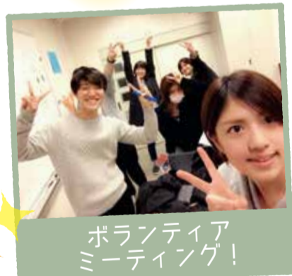
ボランティアミーティング！

「子どもたちによる子どもたちのための架空のまち」を企画！ボランティアの学生たちでーから試行錯誤。いろんな子どもたちが参加できるようにとがんばっています。