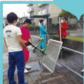
おそろいのツナギで作業する若者たち