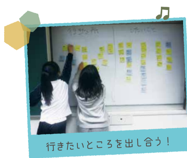
行きたいところを出し合う！

毎日のように「食の安全」に関するニュースが流れていますが、日々口にしている食品について、それが一体どんな場所でどんな人たちによって作られているのか考えてみたことがありますか？例えば「おとうふ」。とてもなじみのある食品ですが、実は工場で大産産されてスーパーに並べられているものとは違うやり方で、私たちのところに届くものもあるのです。この本を読んでみませんか？一緒に「おとうふ」の作り方を勉強してみませんか？信じられないかもしれませんが「おとうふ」の元は堅い大豆。それがどんな方法であんなにやわらかい「おとうふ」に変身するのでしょうか。商店街の「おとうふやさん」が丁寧に教えてくれます。今夜のおかず「おとうふ」が出たら、その作り方をぜひみんなに教えてあげてください。