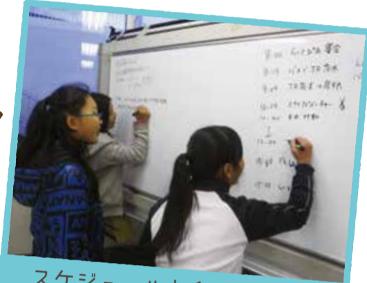
スケジュールも自分たちで！

「ぴあぴあのお出掛けでどこか行きたい」の一言から始まった「卒業お出掛け企画」。話し合いを重ねて、3月に滋賀県のびこねスカイアドベンチャーに行くことになりました！そんな楽しそうな6年生のやりとりを見ていた5年生は「来年は僕たちや！」と一年後のお出掛けを楽しみにしています。