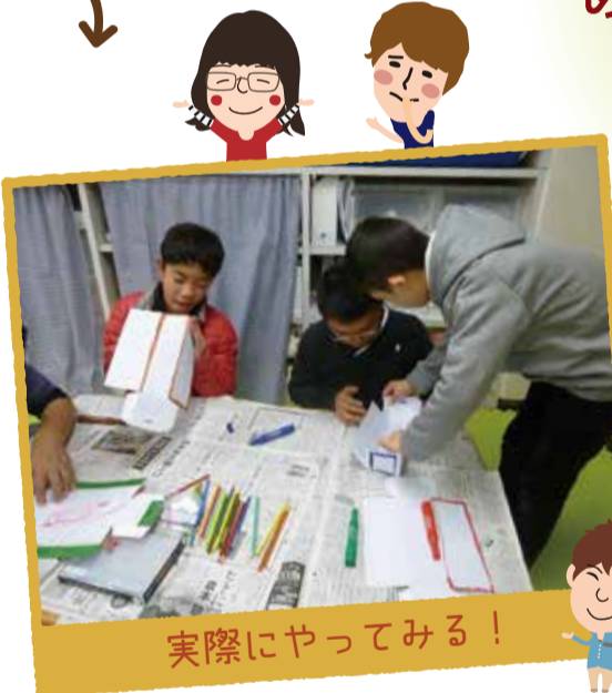
実際にやってみる！

ぴあぴあルーム内にある放課後等デイサービス費の子では毎日のプログラムの中で子ども達自身が主体となりプログラムを企画・計画・実施する「子ども企画」をおこなっています。子ども達の「やりたい！」をスタッフと一緒に形にしています。