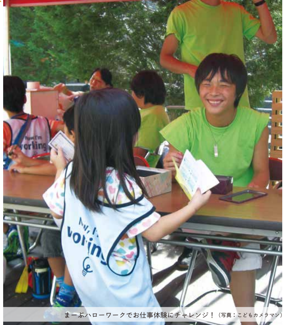
まーぶハローワークでお仕事体験にチャレンジ!

発行/らいとぴあ21(箕面市立萱野中央人権文化センター) 発行日/2016年3月1日