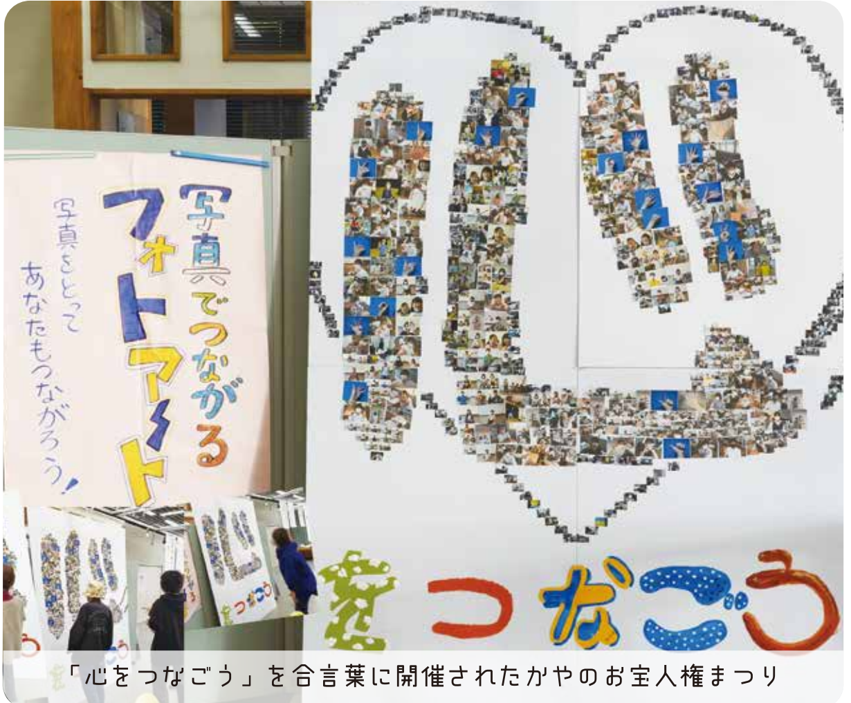
「心をつなごう」を合言葉に開催されたかやのお宝人権まつり