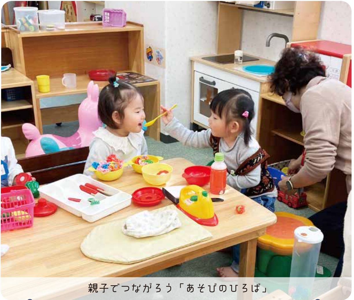
親子でつながろう「あそびのひろば」