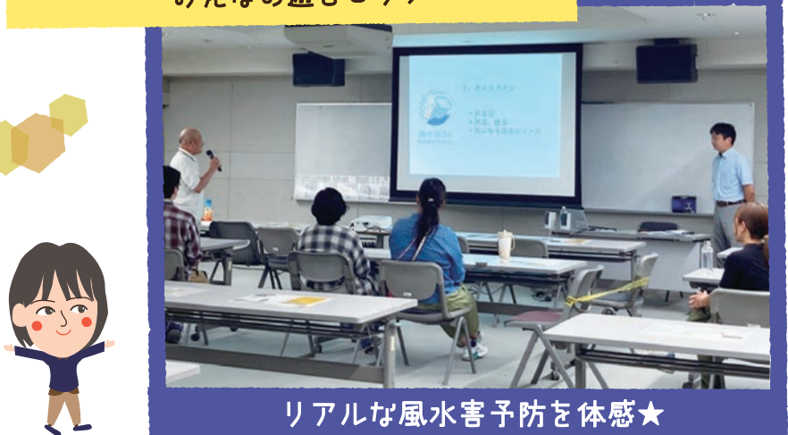
リアルな風水害予防を体感★