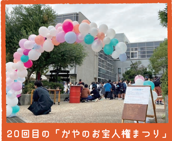
20回目の「かやのお宝人権まつり」