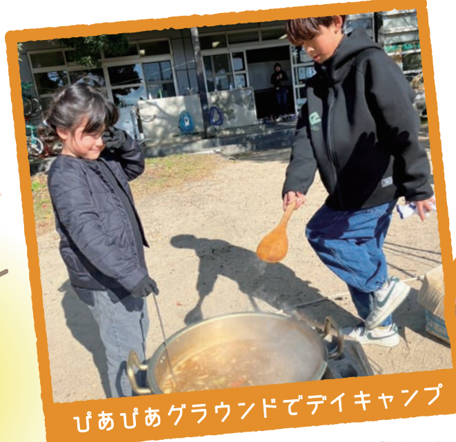
びびあグラウンドでデイキャンプ