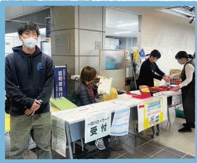
1日ハローワークを開催