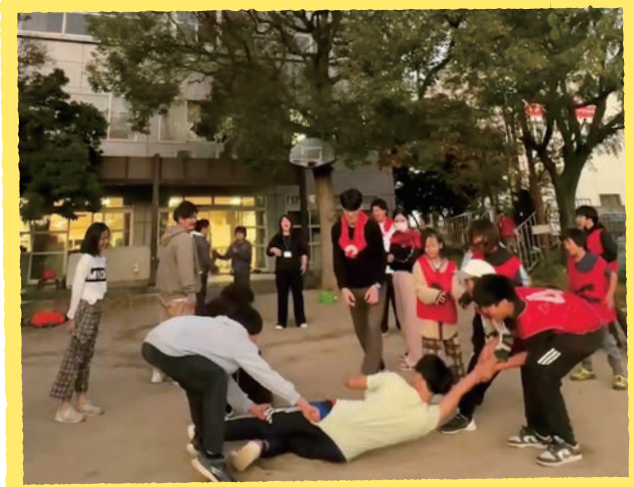
みんなの遊びSケン

「らいとぴあ21ってどんなところ?」「ふだん何をしているの?」 ここでは、らいとぴあ21のできごとやお知らせを、日々のヒトコマ写真に乗せてお届けします。ぜひ気軽にお立ち寄りください。